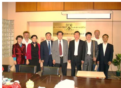
集团领导与代表团合影